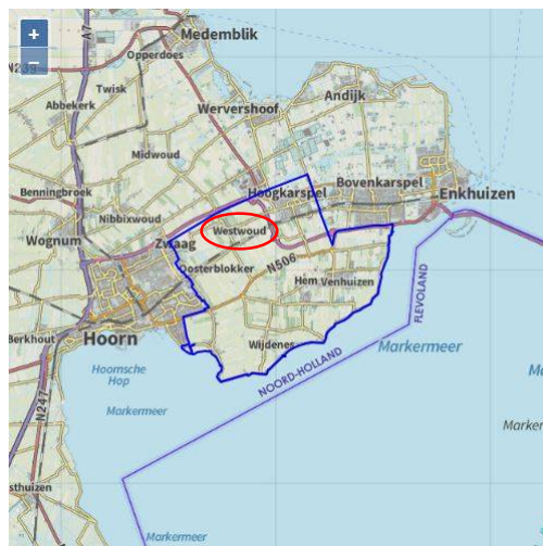
Fig. 1 – De vindplaats Drechterland.

W AAR IEDERE DETECTORAMATEUR, laat staan een archeoloog of numismaat, van droomt, werd op een regenachtige dag met zuidwesterstorm in november van 2016, om precies te zijn zondag 20 november, werkelijkheid voor drie West-Friese beoefenaars van deze spannende en zeer tot de verbeelding sprekende hobby. [1] Eerder die dag had het drietal afgesproken op een weiland dat te nat bleek te zijn, waarna ze besloten tijdelijk te gaan schuilen voor de buien. Omdat het maar niet ophield met regenen, gingen ze na ongeveer 20 minuten verder op een andere akker in Westwoud (gemeente Drechterland in Noord-Holland binnen de driehoek Hoorn-Enkhuizen-Medemblik; zie het blauw omrande gebied in Fig. 1 ), uiteraard nadat ze toestemming hadden gevraagd aan de eigenaar van het stuk land. Omdat het steeds heviger was gaan regenen, besloten ze om na een uur weer te gaan schuilen. Tegen 13h30, net toen ze wilden opgeven, werd het droog en ging de zoektocht naar verborgen schatten verder, waarbij de metaaldetector van één van de drie opeens reageerde. Al snel bleek net onder de bouwvoor een Filipesdaalder tevoorschijn te komen die het signaal van de detector had doen afgaan. Kort daarop gingen ook de detectoren af van de twee anderen, die inmiddels tot op een afstand van 50 m waren komen aanlopen.